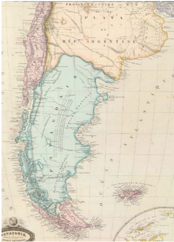
Las Pampas y la Patagonia según un mapa francés de 1862.

“...el tango es un pensamiento triste que se baila.”