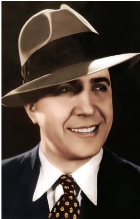
Carlos Gardel (1887-1935)

De inmigrantes a argentinos. Mientras tanto, los inmigrantes iban progresando, se afincaban en las ciudades y construían sus barrios obreros y de incipiente clase media. El deseo sexual se hizo más complejo, matizado con sentimientos de nostalgia, frustración, sueños, melancolía, aspiraciones y desengaños. Mientras poco a poco, se convertían en argentinos, la vida de estos inmigrantes era aún inestable y precaria, sujeta a duras incertidumbres económicas y sociales, luchando contra el estigma de los recién llegados. No es nada extraño, entonces, que Carlos Gardel, el más importante representante del